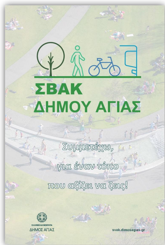
Εικόνα 3: Αφίσα έργου του ΣΒΑΚ Δήμου Αγιάς

Επιπλέον, ο Ανάδοχος σχεδίασε την αφίσα του έργου που φαίνεται στην Εικόνα 3 , που ακολουθεί. Η παραγωγή αυτής σε ικανό πλήθος αντιτύπων (περίπου 20-30), θα γίνει από την Αναθέτουσα Αρχή, προκειμένου αυτά να χρησιμοποιηθούν στις Δημόσιες Διαβουλεύσεις (εφόσον αυτές γίνουν δια ζώσης) ή να τοποθετηθούν σε διάφορες θέσεις της πόλης (Δημαρχείο, Δημόσιες Υπηρεσίες, σχολεία, κλπ.).